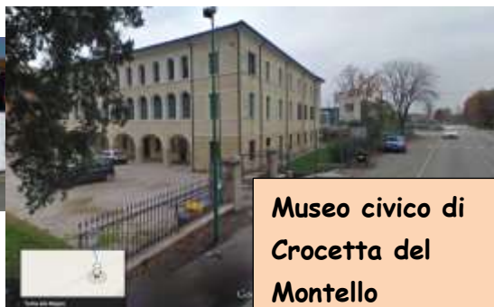
Museo civico di Crocetta del Montello

Due plessi, quattro classi, un unico scopo: