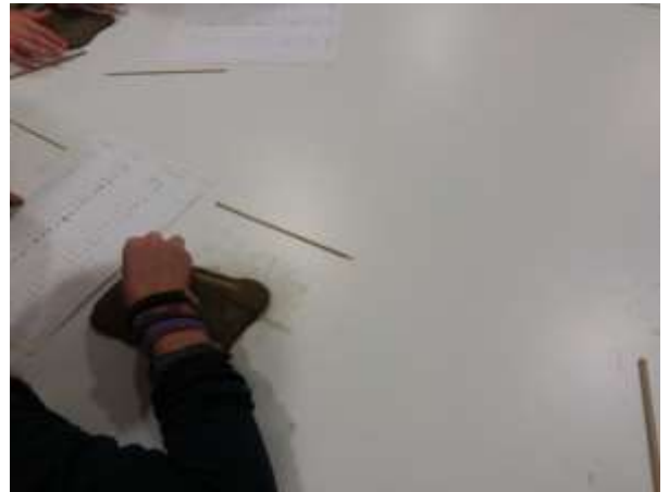
Classe quarta: visita al museo, sezione antiche civiltà e laboratorio scrittura su tavoletta d'argilla