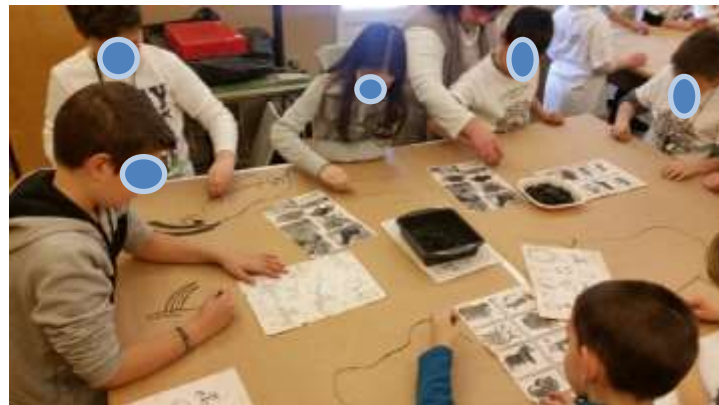
Classe quinta: lezione sui Paleoveneti e laboratorio sbalzo su rame